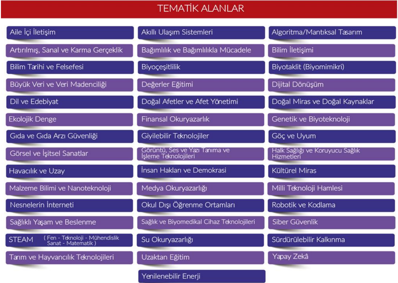
Şekil 3. Tematik Alanlar

Bu ana alanlarda yarışmaya başvuracak projelerin, aşağıda isimleri verilen tematik alanlardan birini kapsayacak şekilde hazırlanmış olması gerekir (Şekil 3).