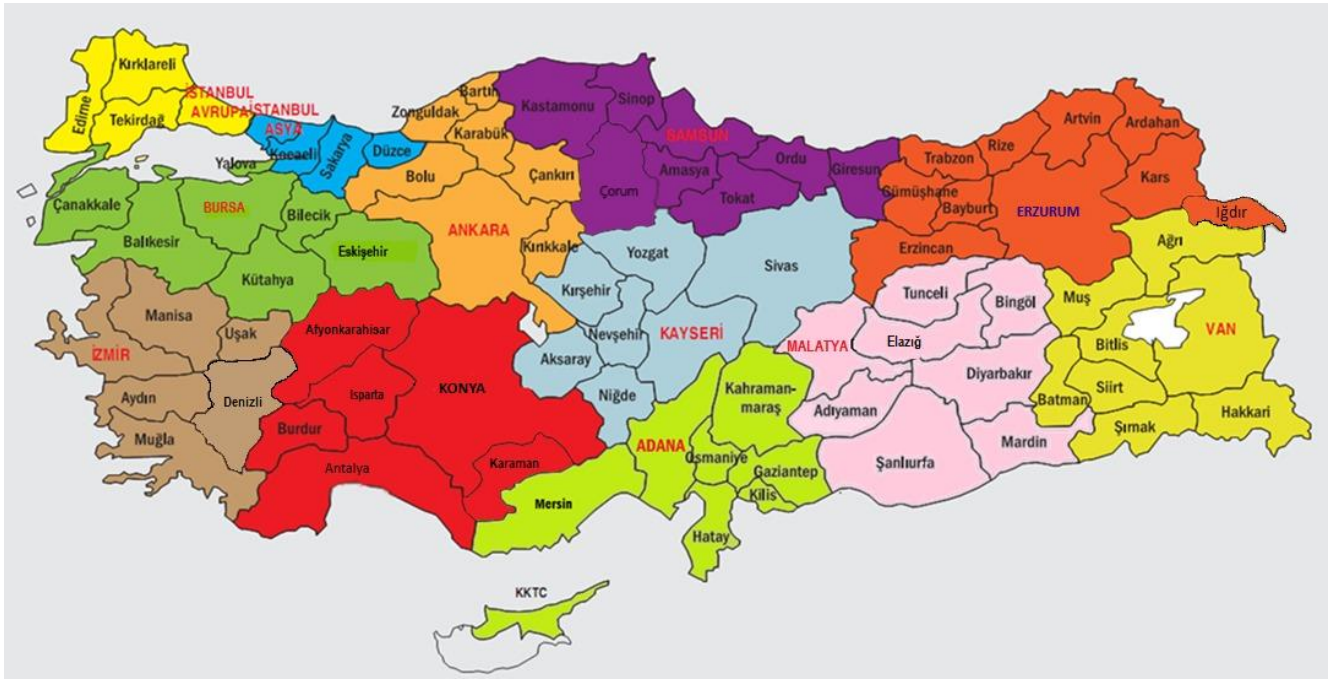
Şekil 1. Yarışma Bölgeleri Haritası

Bu yarışma, Türkiye genelinde 12 bölgede yapılmaktadır. Her bölge için bir il, merkez olarak seçilmiştir. Her bölgenin il merkezinden iki öğretim üyesi, TÜBİTAK tarafından yarışmalardan sorumlu Bölge Koordinatörü ve Bölge Koordinatör Yardımcısı olarak görevlendirilir. Adana, Ankara, Bursa, Erzurum, Konya, İstanbul Asya, İstanbul Avrupa, İzmir, Kayseri, Malatya, Samsun ve Van bölge merkezi illerdir. İllerin bölgelere göre dağılımları Şekil 1'de verilmiştir.