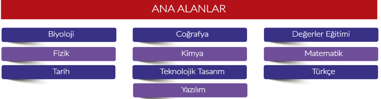
Şekil 2. Ana Alanlar

Yarışma, 10 ana alanda düzenlenmektedir (Şekil 2).